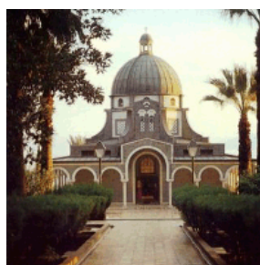
八福山 Mt of Beatitudes