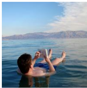
死海 Dead Sea