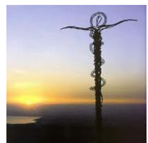
尼波山 Mount Nebo