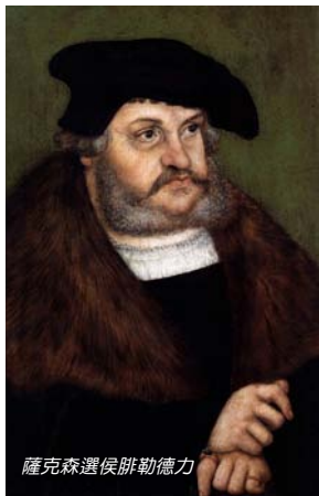
薩克森選侯腓勒德力