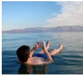
死海 Dead Sea