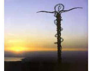
尼波山 Mount Nebo