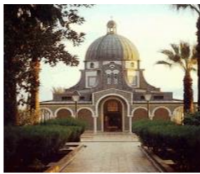
八福山 Mt of Beatitudes