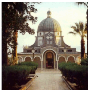
八福山 Mt of Beatitudes