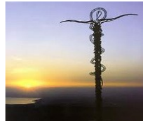
尼波山 Mount Nebo