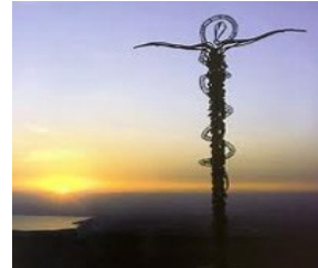
尼波山 Mount Nebo