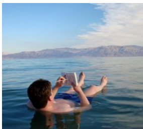
死海 Dead Sea