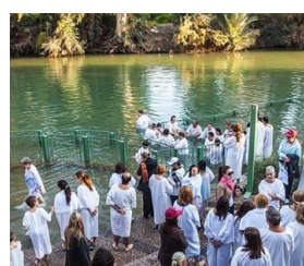
約旦河 Jordan River