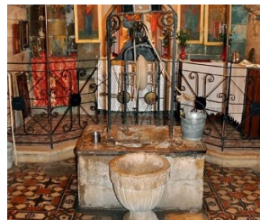
雅各井 Jacob's Well