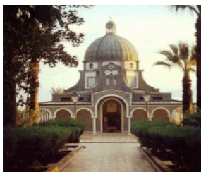
八福山 Mt of Beatitudes